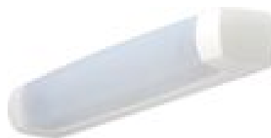
EO SIMPLE AVEC DIFFUSEUR + TUBE LED 0.553.11