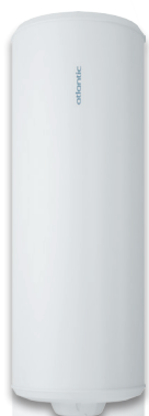
Vertical Mural 50, 75, 100, 150 et 200L