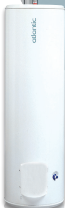
Vertical sur Socle 200, 250 et 300L