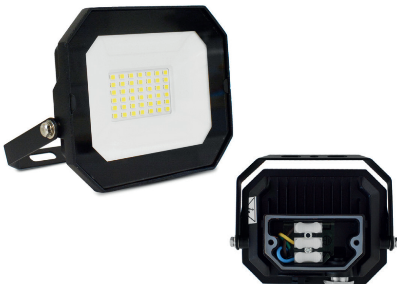
Connecteur interne + presse-étoupe + valve anti-condensation