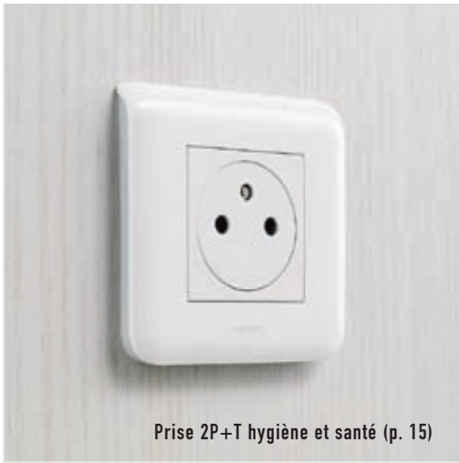
Prise 2P+T hygiène et santé (p. 15)