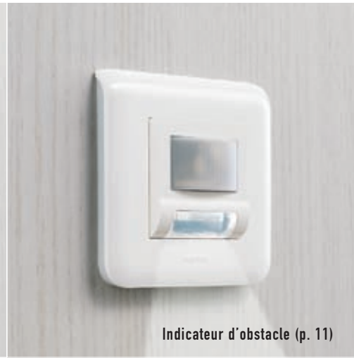
Indicateur d'obstacle (p. 11)