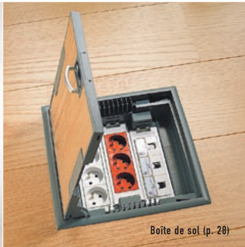
Boîte de sol (p. 28)