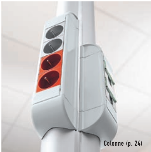
Colonne (p. 24)

Des solutions pour équiper vos bureaux et lieux de travail