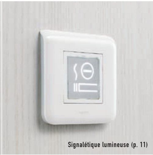
Signalétique lumineuse (p. 11)