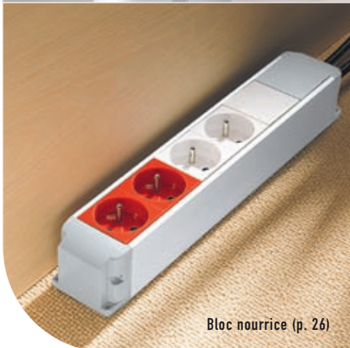
Bloc nourrice (p. 26)