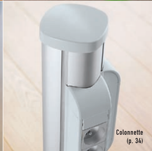
Colonnette (p. 34)