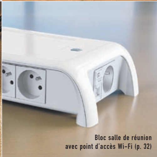
Bloc salle de réunion avec point d'accès Wi-Fi (p. 32)