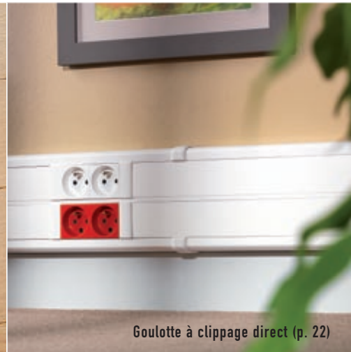
Goulotte à clippage direct (p. 22)